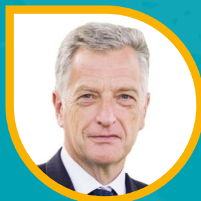
Hervé GAYMARD Président du conseil départemental de la Savoie herve.gaymard@savoie.fr 04 79 96 73 73