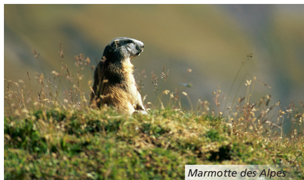
Marmotte des Alpes