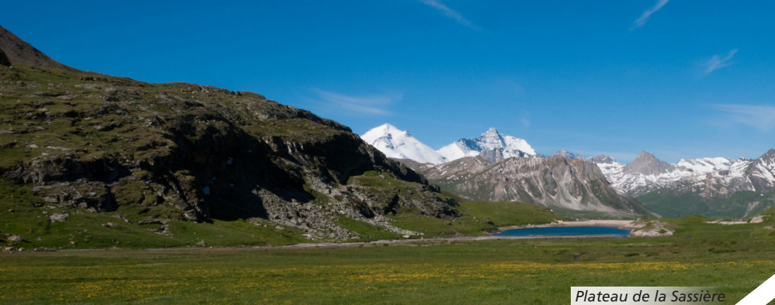
Plateau de la Sassière