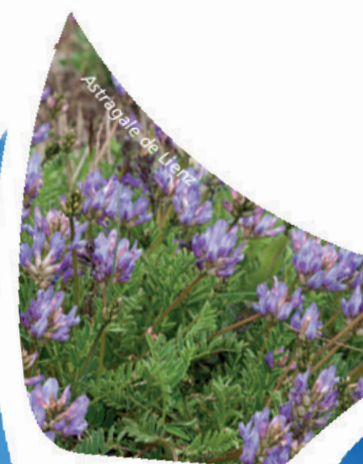
Astragale de Lienz

les Alpes, les huit espèces typiques des marais calcaires de l'étage alpin sont présentes comme le Jonc arctique et la Tofieldie boréale.