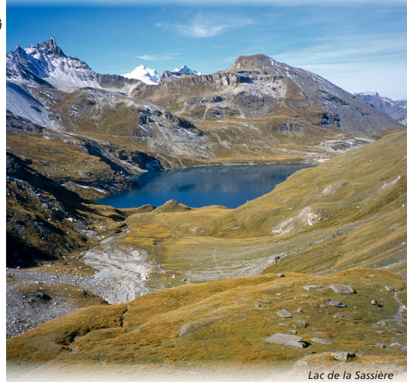
Lac de la Sassièrè