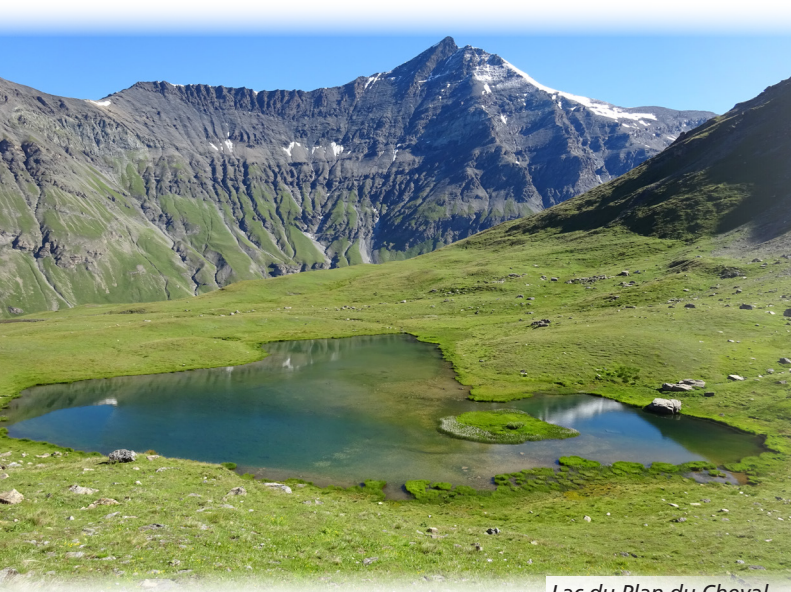
Lac du Plan du Cheval