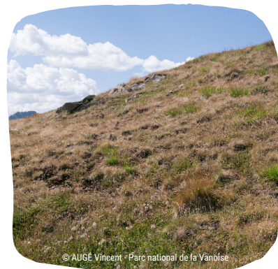
Pelouse alpine grillée fin juillet après l'épisode de sécheresse et de canicule de 2015

Lors des prochaines décennies, les scénarios climatiques prévoient des aléas climatiques plus intenses et plus fréquents, notamment des gels tardifs et des sécheresses estivales de plus en plus prononcées. Face à la diminution de la période d'enneigement, la végétation est moins protégée contre les épisodes de froid. Les périodes de sécheresse limitent également la disponibilité en eau dans les sols, entraînent une évapotranspiration accrue et favorisent la sénescence des végétaux. Selon les années, ces événements climatiques pourront grandement impacter la qualité et la quantité des ressources (Chaix et al., 2017 ; Inouye, 2020).