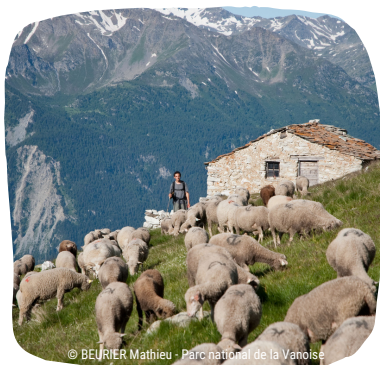
Transhumance des brebis vers le Col du Barbier

Suite à l'augmentation des températures et à la fonte précoce du manteau neigeux, un allongement de la période de croissance de la végétation est prévisible. On observe déjà une augmentation de la productivité et ainsi à une augmentation des ressources disponibles (cf. verdissement des Alpes, Carlson et al, 2017). Néanmoins, un démarrage plus précoce de la végétation implique des adaptations des pratiques agricoles, avec notamment une avancée de la période d'estive pour que les troupeaux s'alimentent au moment où la végétation est à son pic de qualité fourragère (Chaix et al., 2017). Potentiellement, ces adaptations pourraient entraîner des pressions accrues sur des milieux jusqu'alors préservés, notamment en cas de remontées des troupeaux vers de plus hautes altitudes.