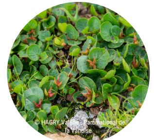
Le saule herbacé, une espèce typique des combes à neige