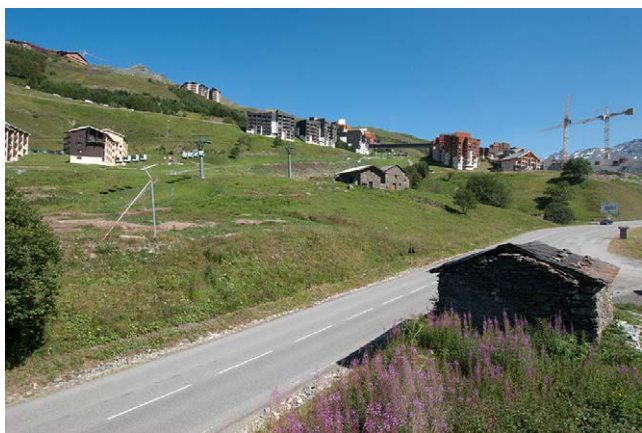
oppv-011-03 - 2010