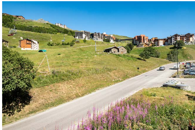
oppv-011-13 - 2020