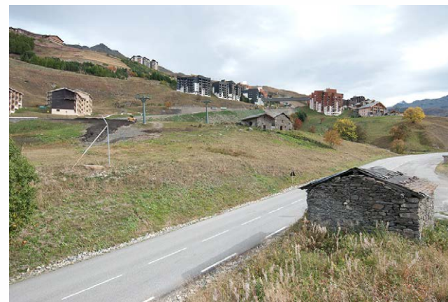
oppv-011-02 - 2009