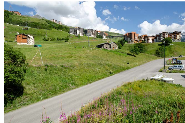
oppv-011-14 - 2021