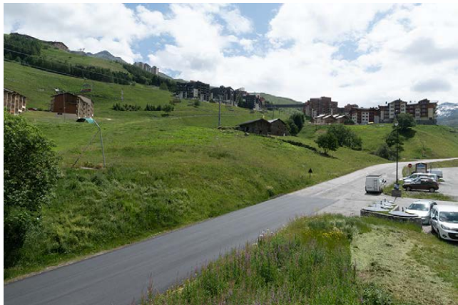
oppv-011-12 - 2019