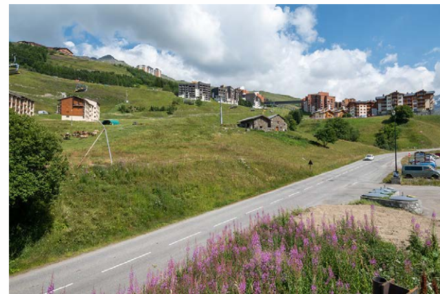
oppv-011-11 - 2018