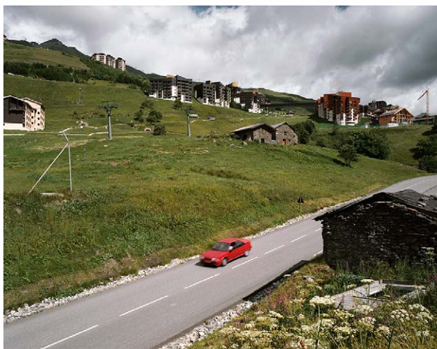
oppv-011-01 - 2008