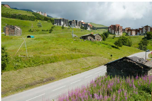
oppv-011-09 - 2016