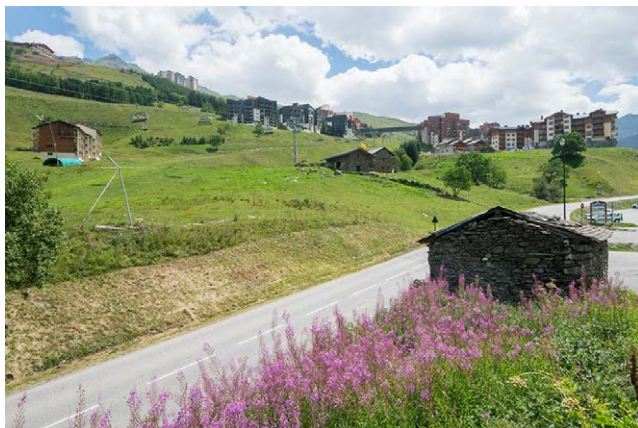
oppv-011-10 - 2017