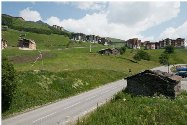
oppv-011-06 - 2013