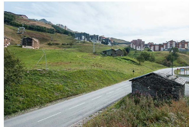
oppv-011-08 - 2015