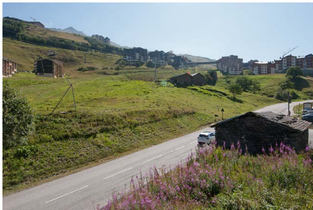
oppv-011-07 - 2014