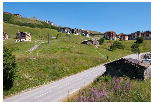
oppv-011-05 - 2012