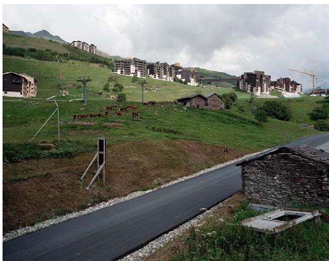
oppv-011-00 - 2007