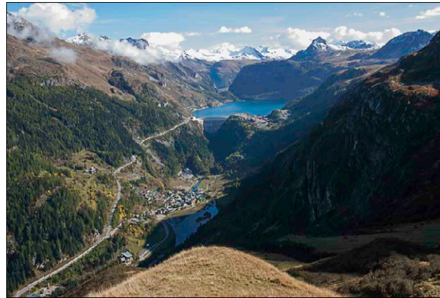
oppv-093-04 - 2015