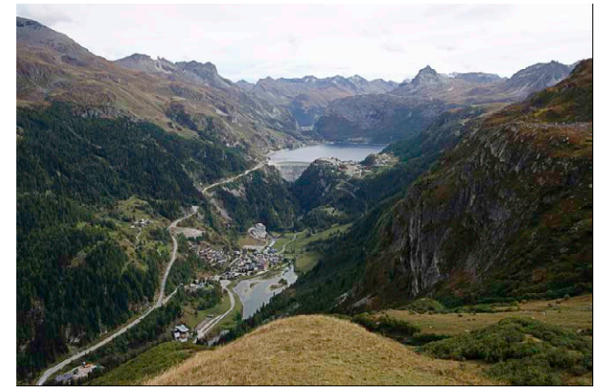
oppv-093-02 - 2013