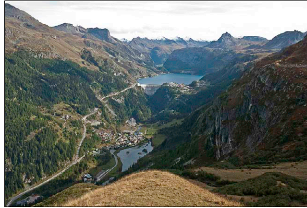
oppv-093-01 - 2012