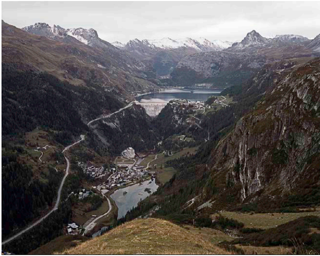
oppv-093-00 - 2007