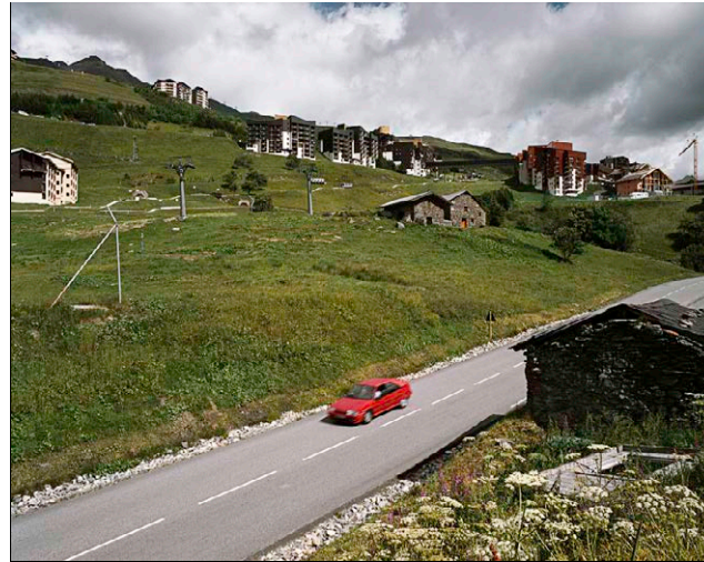
oppv-011-01 - 2008