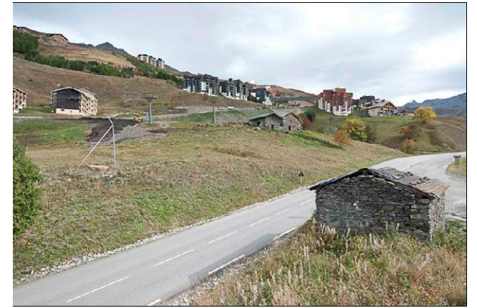
oppv-011-02 - 2009