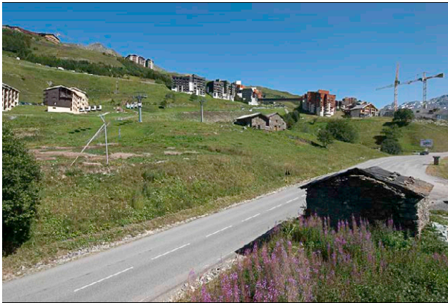
oppv-011-03 - 2010