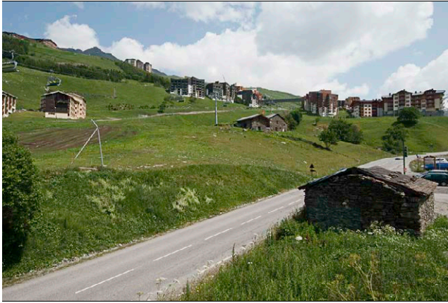
oppv-011-06 - 2013