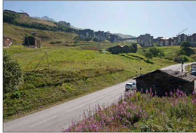
oppv-011-07 - 2014