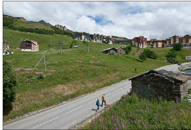
oppv-011-04 - 2011