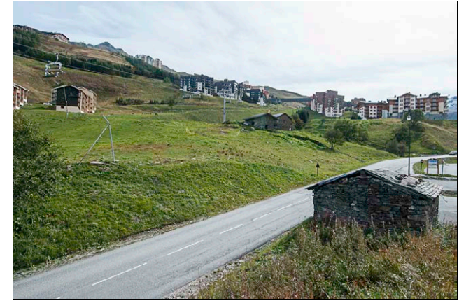
oppv-011-08 - 2015