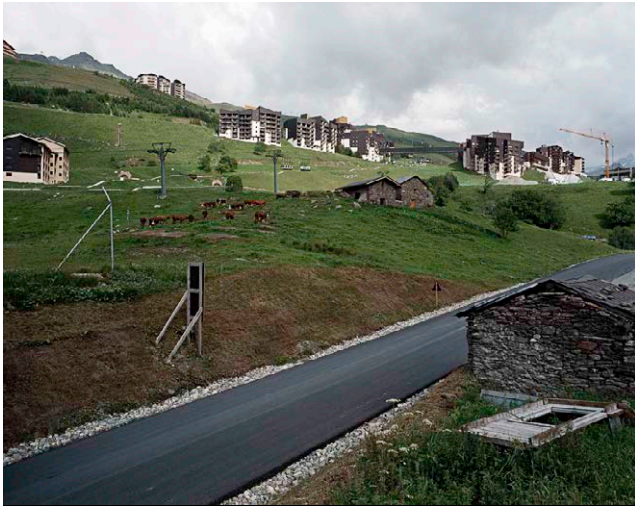
oppv-011-00 - 2007